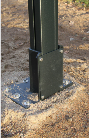
Fästplatta på gjuten plint.